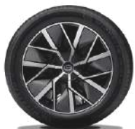
Rin Blade - Edge de 20" Llantas Michelin Pilot Sport 4