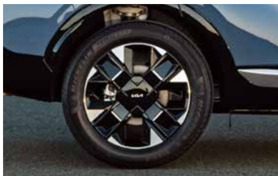
Rines de aluminio de 19"

Rines de diseño aerodinámico y acabado brillante que no solo mejoran su apariencia, sino que también contribuyen a una conducción estable.