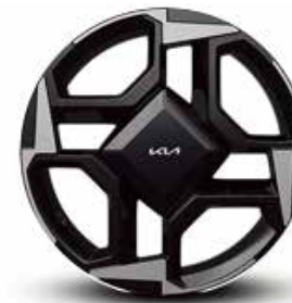
Rin de aluminio de 18" (EX | EX PACK)