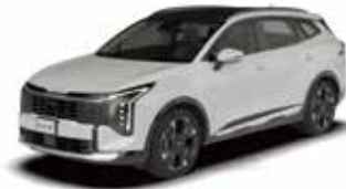
Snow White Pearl