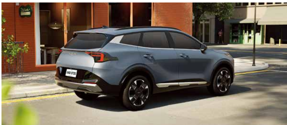
Encendido remoto de motor desde llave inteligente

Los faros verticales de Kia Sportage transmiten una presencia imponente y segura, mientras que las tiras cromadas horizontales que integran los elementos de luz diurna añaden un toque de sofisticación y elegancia, creando una imagen poderosa y refinada.