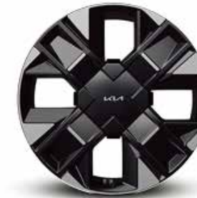
Rin de aluminio de 19" (SXL | SXL HALE NAVY)