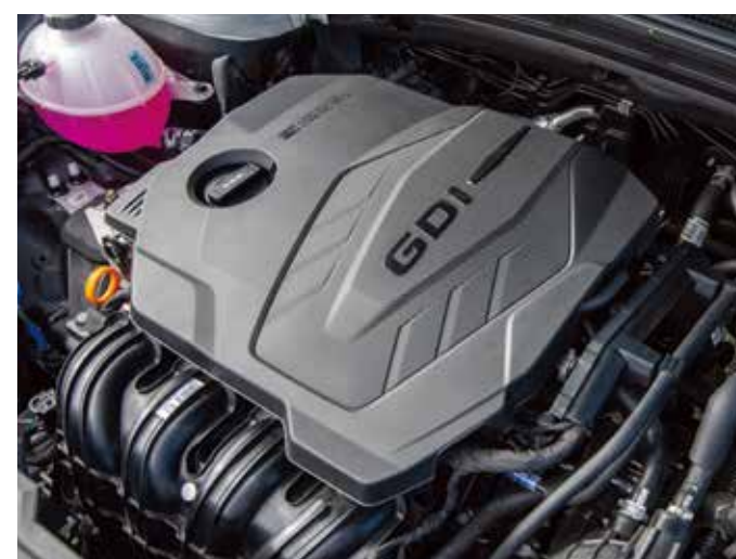
Motor de 2.5 L GDI

Kia Sportage te envuelve en una experiencia de conducción única. Su confort y diseño innovador te mantienen conectado y al mando en cada kilómetro, haciendo de cada viaje un placer sin igual.