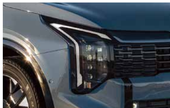
Faros cúbicos de proyección LED

Rines de diseño aerodinámico y acabado brillante que no solo mejoran su apariencia, sino que también contribuyen a una conducción estable.